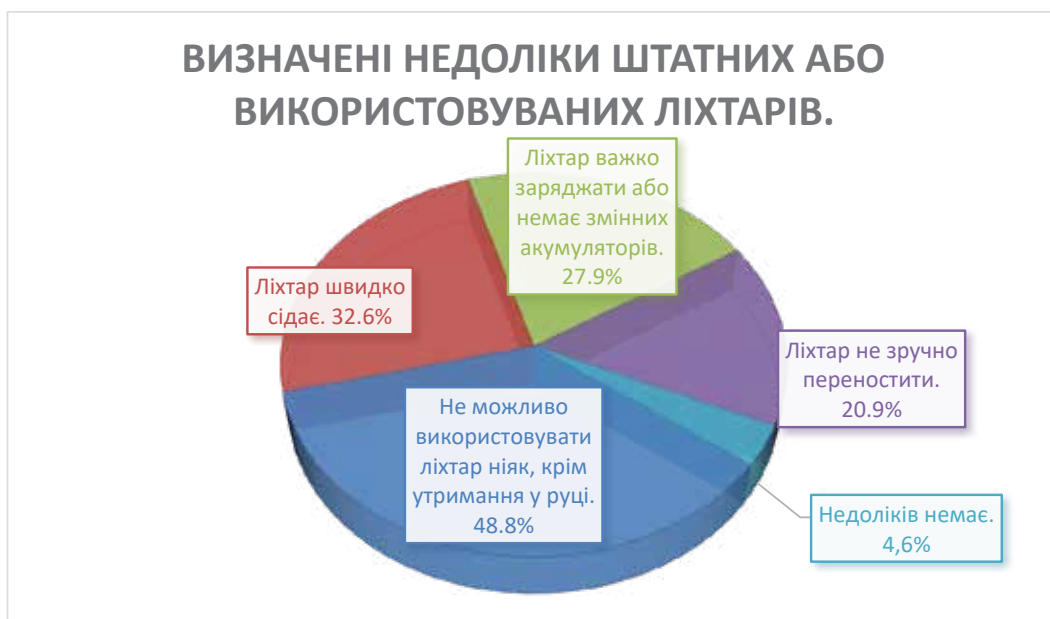
Діаграма 3. Результати опитування з недоліків використовуваних ліхтарів

За результати опитування поліцейські визначили, що найбільш важливим показником є потужність та стійкість до ударів ліхтаря, а найменшими – стійкість до вологи та якість деталей , з яких виготовлений ліхтар.