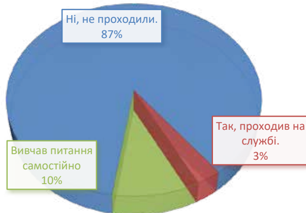
Діаграма 2. Стан освітлення питання використання службового ліхтаря у підрозділах поліції

ми опитування встановлено, що лише 3% поліцейських проходили навчання з тактики використання службового ліхтаря під час підготовки до несення служби, та 10% вивчали це питання самостійно після того, як зіткнулися з труднощами з використанням засобів освітлення під час несення служби.